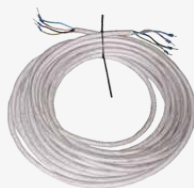
Zestaw kabli 10 m