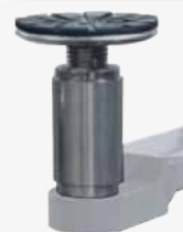
Zestaw przedłużeń do podnośników 50 mm (4 pcs)