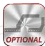
Zestaw dużego wspornika (opcja)