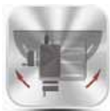
Obracany wspornik tokarki